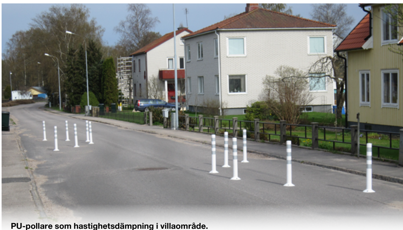
PU-pollare som hastighetsdämpning i villaområde.